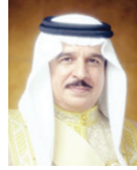
جلالة الملك المعظم