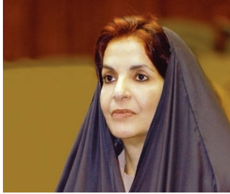
○ سمو الأميرة سبيكة بنت إبراهيم آل خليفة.