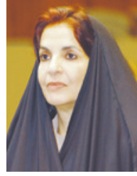
قرينة الملك المعظم

تلقي حضرة صاحب الجلالة الملك حمد بن عيسى آل خليفة عامل البلاد المعظم برفيقي تهنئة من رئيسة مجلس النواب فوزية زينل ورئيس مجلس الشورى علي الصالح بمناسبة الذكرى الحادية والعشرين لتأسيس المجلس الأعلى للمرأة، رفعا فيها إلى مقام جلالة السامي، أطيب التهاني وخلص التبريكات بهذه المناسبة مشيدين بما تحققت من تقدم وإنجازات متميزة للمرأة البحرينية في مختلف المجالات، وساهمت في دعم الاستقرار الأسري والترابط العائلي، والشراكة الفاعلة في نهضة البلاد وتقدمه في ظل المسيرة التنموية الشاملة، ومؤكدين أن تأسيس المجلس جاء نتاج رؤية ونهج حكيم ورائد من لدن جلالاته والذي شكل دعماً رفيعاً لمسيرة حفلة بالإنجازات الحضارية للمرأة البحرينية